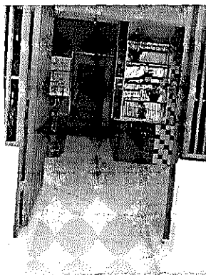
Rampa de Acesso para cadeirante

Banheiro utilizado pelos PCDs, inclusive para cadeirantes.